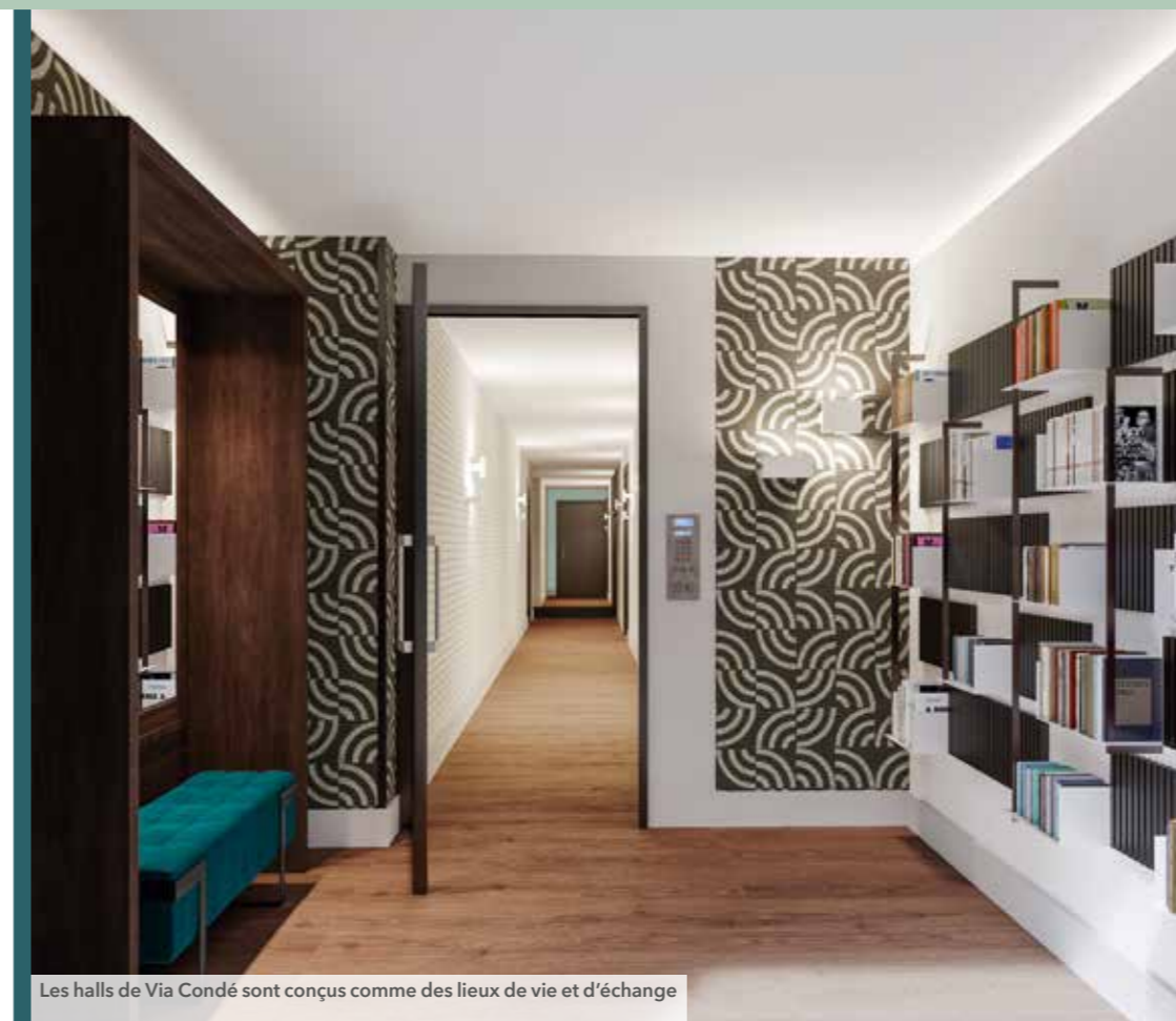
Les halls de Via Condé sont conçus comme des lieux de vie et d'échange

Véritables cocons de bien-être, les appartements sont pour la plupart ouverts sur un balcon, une terrasse ou un jardin privatif.