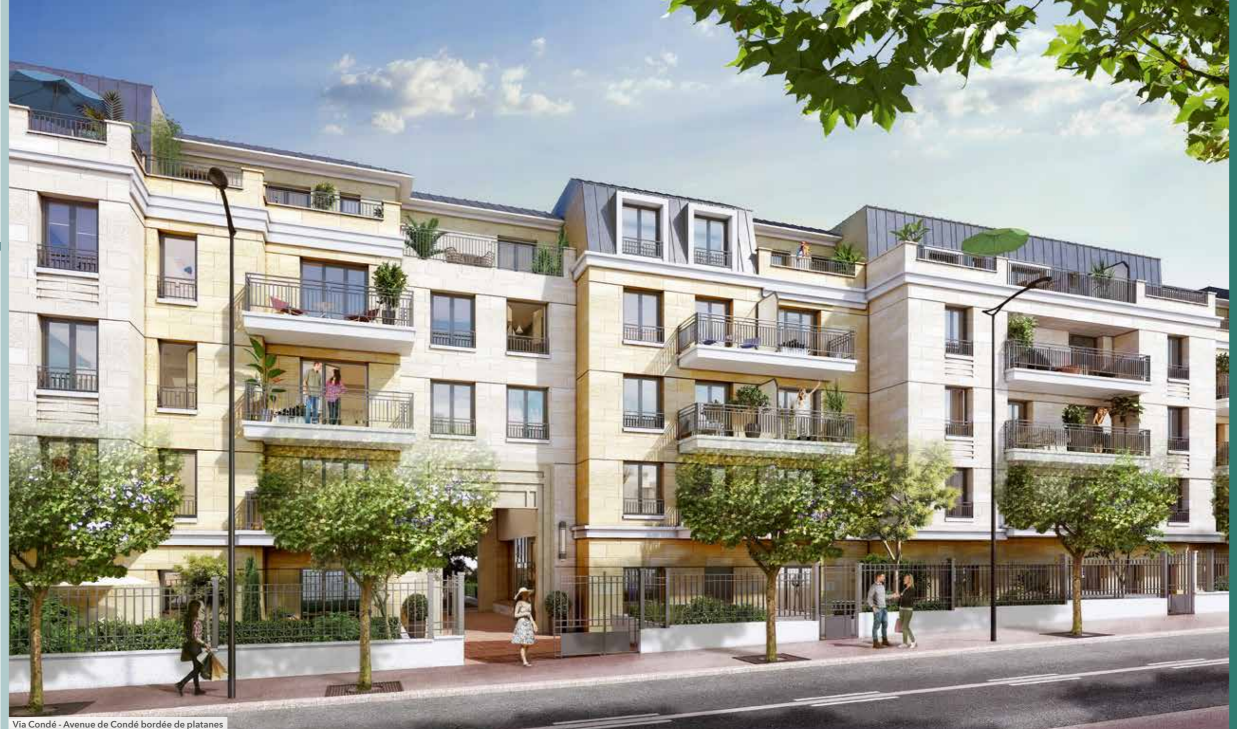
Via Condé - Avenue de Condé bordée de platanes

Le porche majestueux, qui dessert deux halls décorés par une architecte d'intérieur, s'ouvre sur des jardins paysagers et vous offre, depuis la rue, une perspective visuelle romantique évoquant les bords de Marne, tout proches.