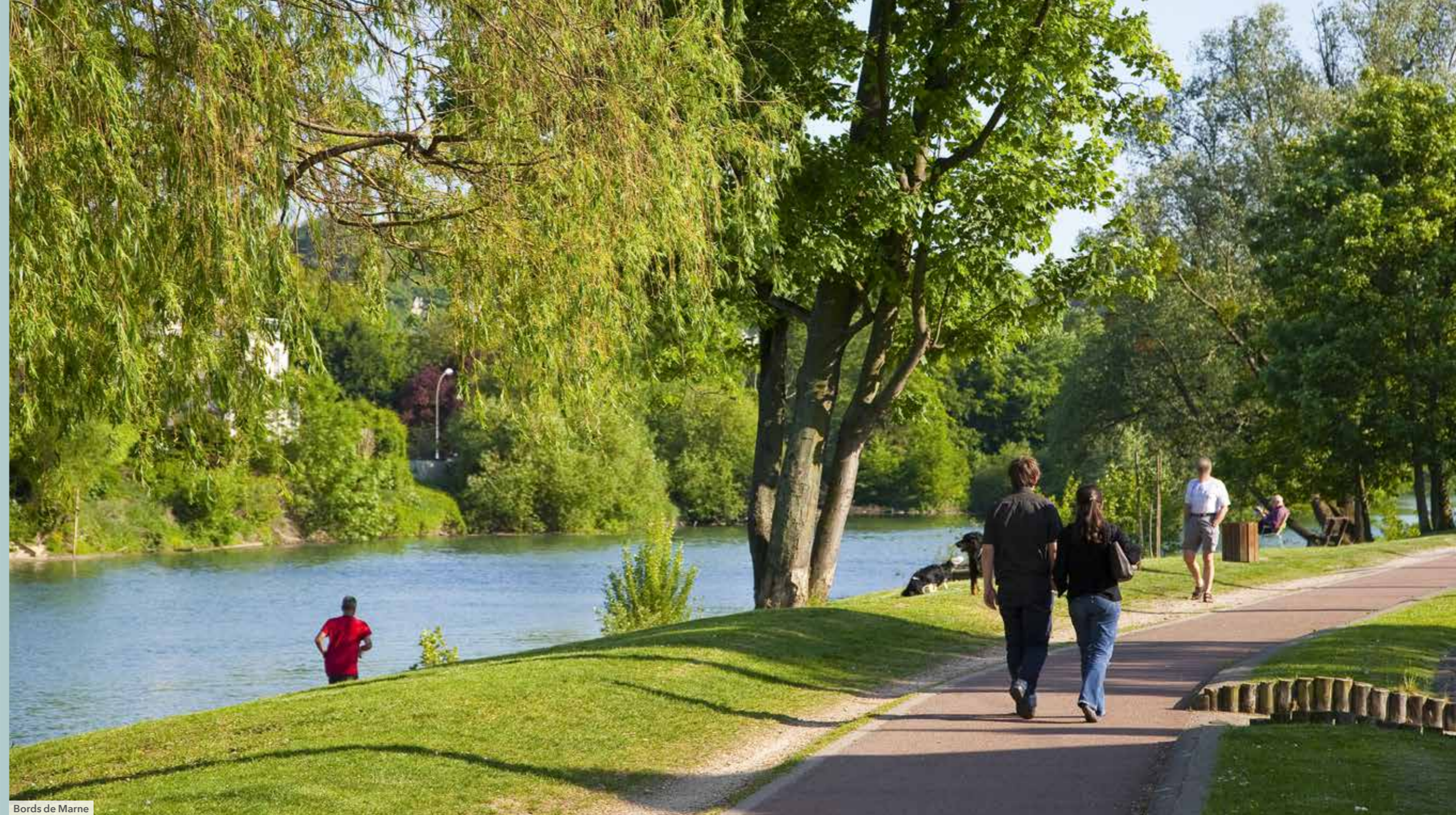
Bords de Marne