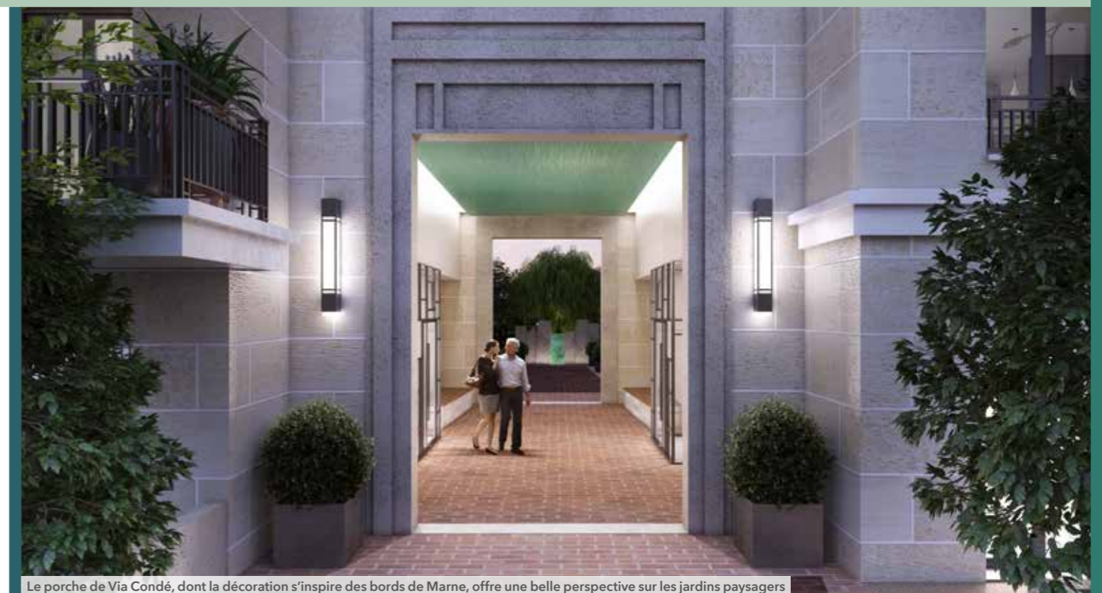
Le porche de Via Condé, dont la décoration s'inspire des bords de Marne, offre une belle perspective sur les jardins paysagers

La démarche architecturale, exprimée à travers une écriture et un choix de matériaux spécifiques, rend hommage aux bords de Marne en s'inspirant de la manière de vivre des Saint-Mauriens et en visant une intégration aisée et évidente au sein du tissu urbain existant.