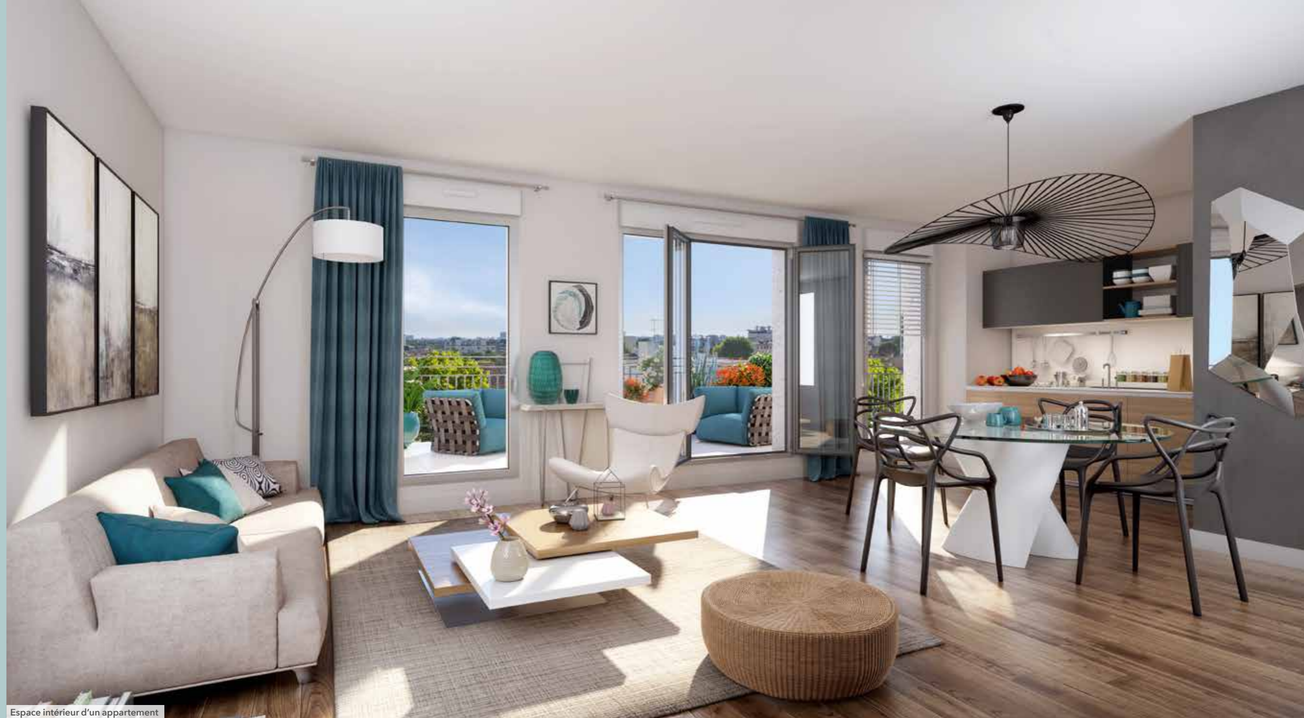
Espace intérieur d'un appartement