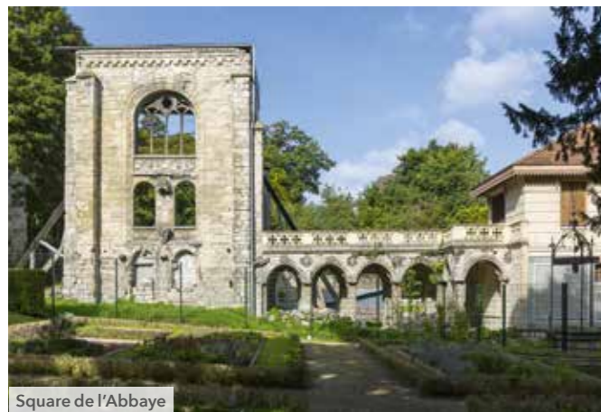
Square de l'Abbaye

Vivre à Saint-Maur-Des-Fossés, c'est profiter d'un quotidien agréable dans une ville active et naturelle. C'est aussi se laisser séduire par son vieux village et ses bords de Marne propices à de belles promenades. Les axes routiers et les transports en commun (4 gares RER, nombreuses lignes de bus, et autoroute A4), vous permettront de rejoindre rapidement le centre de Paris. Enfin, petits et grands auront accès à des équipements sportifs de qualité tels que des bases nautiques, des terrains de tennis, des piscines, des stades et des gymnases.